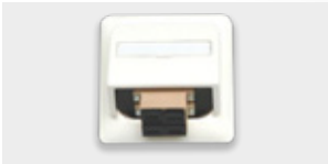
| TUO-C vista frontal