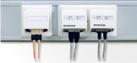
| Terminales ópticos embutidos