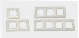
| Marco de instalación 1,2,3 y 4.